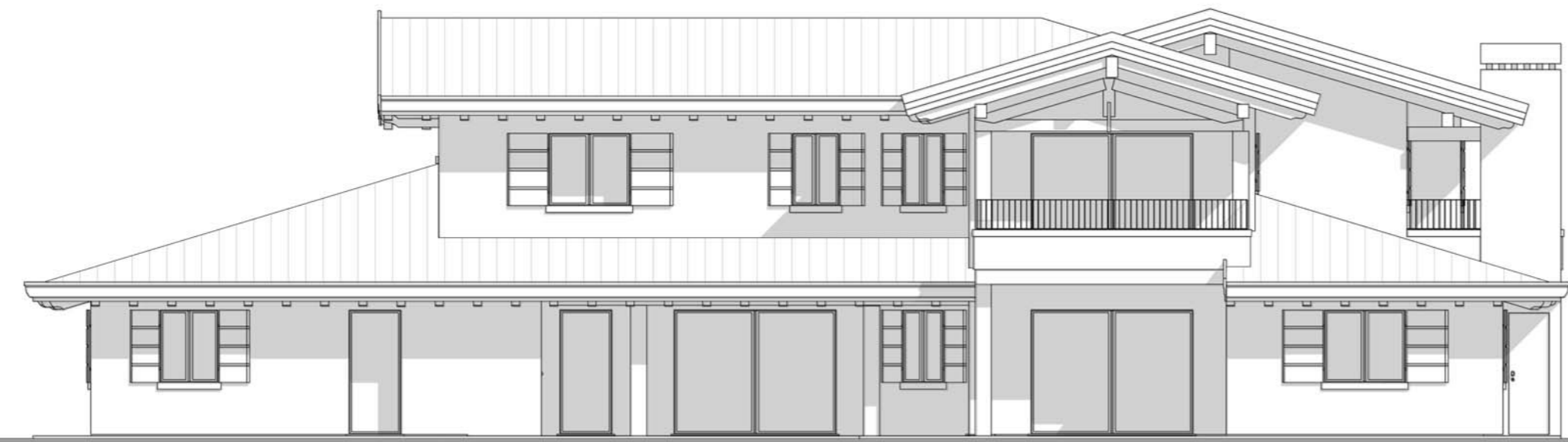
Prospetto SUD - OVEST