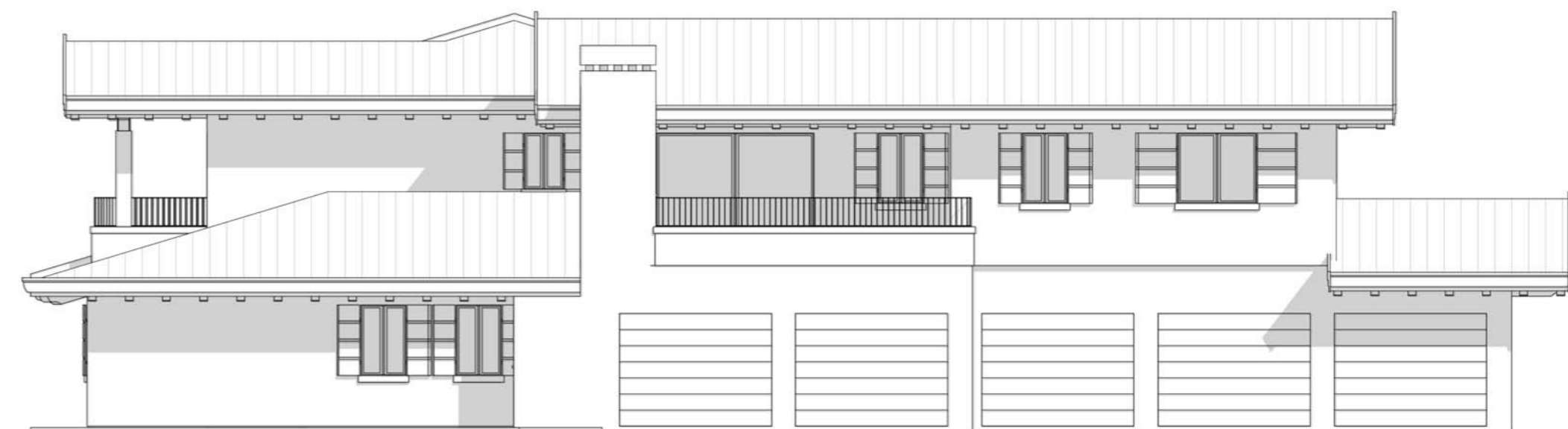
Prospetto SUD - EST