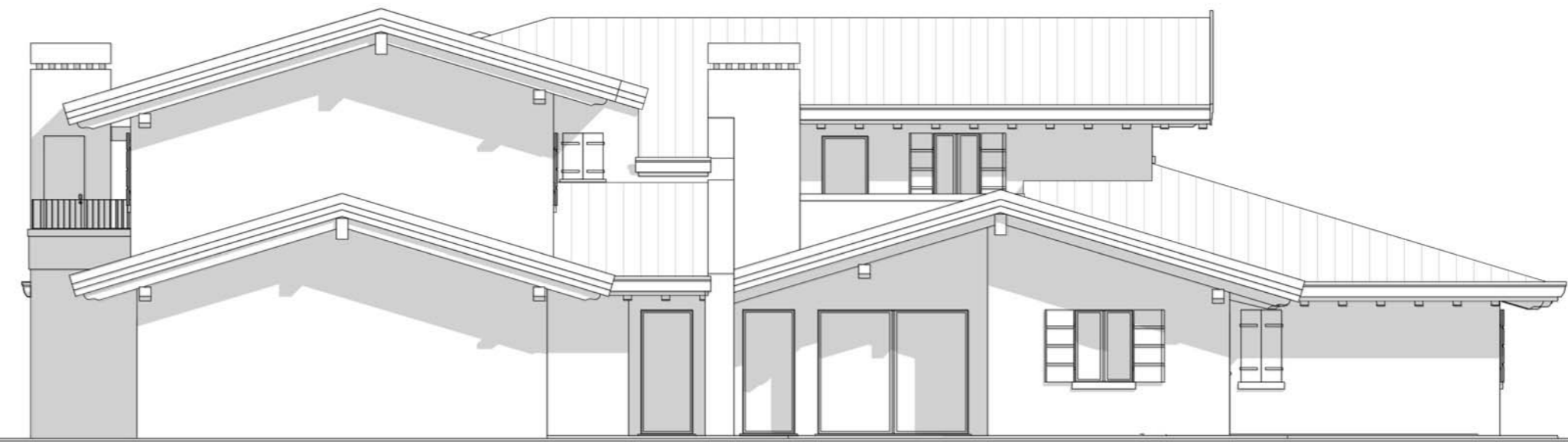
Prospetto NORD - EST